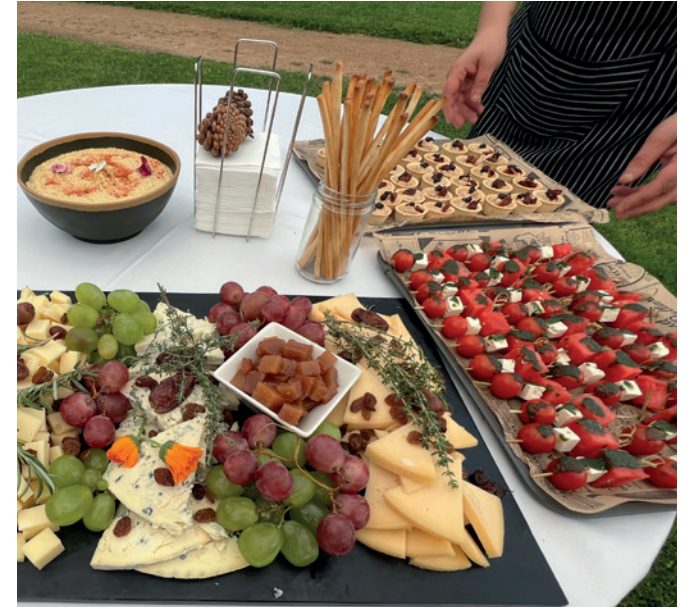
Weekend wedding BODAS